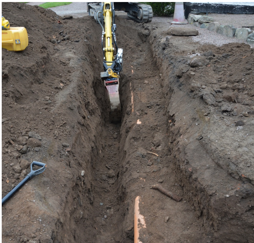
Figur 4. Schaktning av den djupaste schaktdelen med den smala skopan. Den äldre dräneringen och markavloppsrör syns till höger om det djupa schaktet