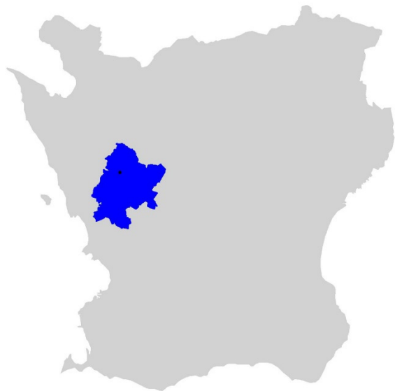
Figur 1. Karta över Skåne med Svalövs kommun markerat med blå färg och Kågeröd med en svart punkt.