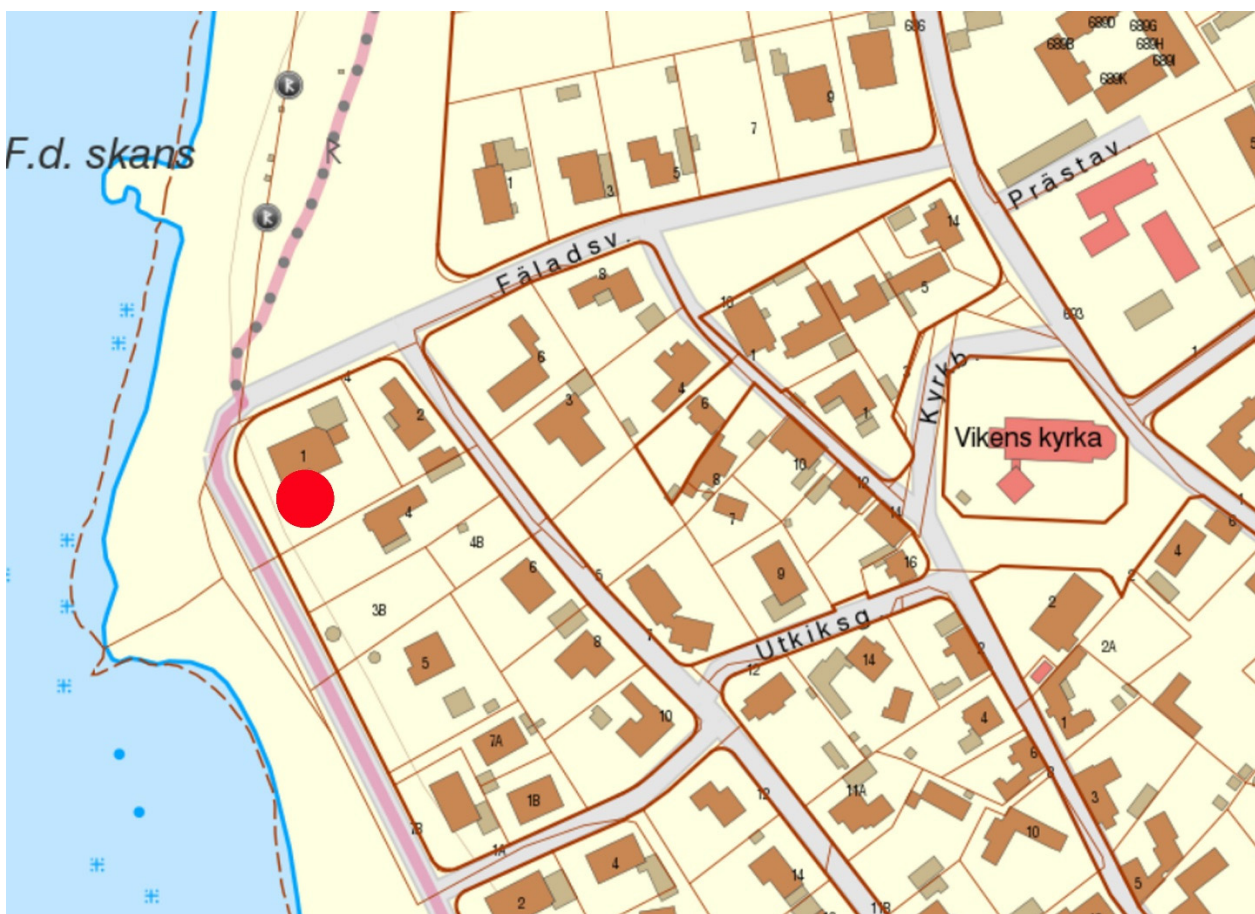
Figur 2. Karta över del av Viken med platsen för undersökningen markerad med röd fylld cirkel. Skala 1:2000.