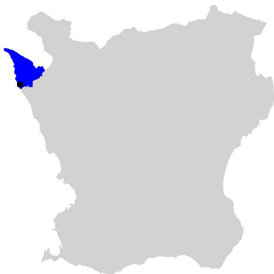
Figur 1. Karta över Skåne med Höganäs kommun markerat med blå färg och Viken med svart fylld cirkel.