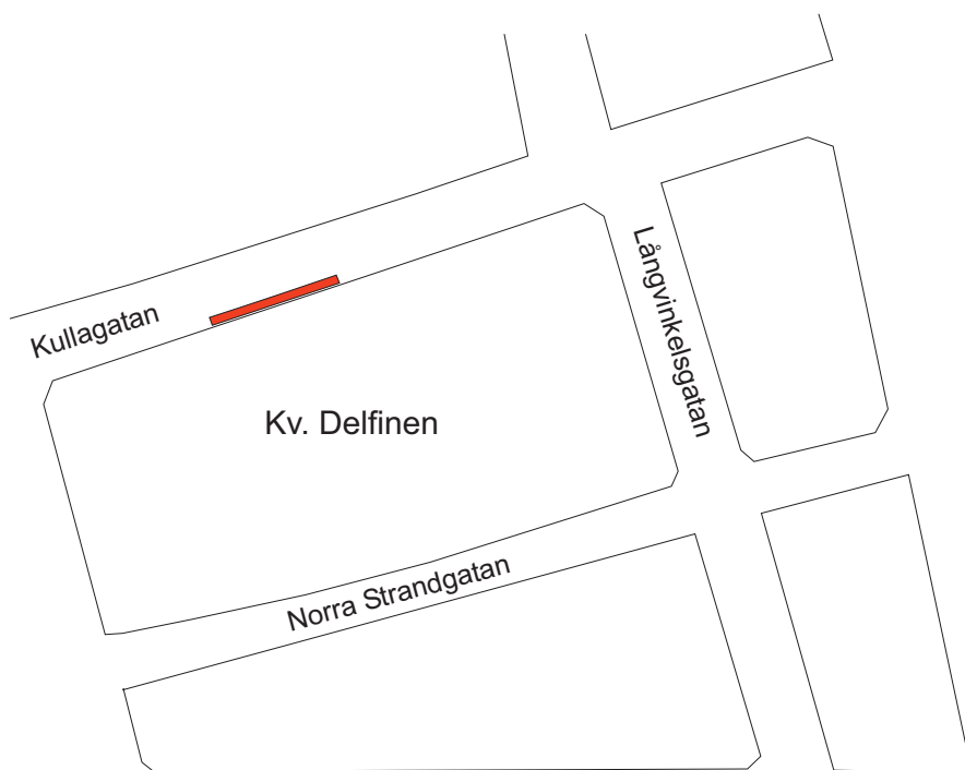
Figur 3. Plan över schaktets läge i norra delen av Kv. Delfinen. Schaktet är rödmarkerat. Skala 1:1 250.

Schaktningen utfördes i etapper för att inte riskera sättningsskador på huset. Endast de första 5 m besiktigades då det kunde konstateras att det förekom rikligt med moderna ledningar och att huset hade uppförts med ett frischakt vilket innebar att endast sentida fyllnadsmassor påträffades. Telefonkontakt med entreprenören Hittarps Bygg bekräftade att även resten av schaktet var av samma karaktär.