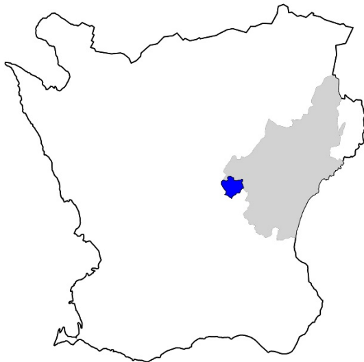
Figur 1. Karta över Skåne med Kristianstads kommun markerat med grå färg och Linderöds socken med blått.