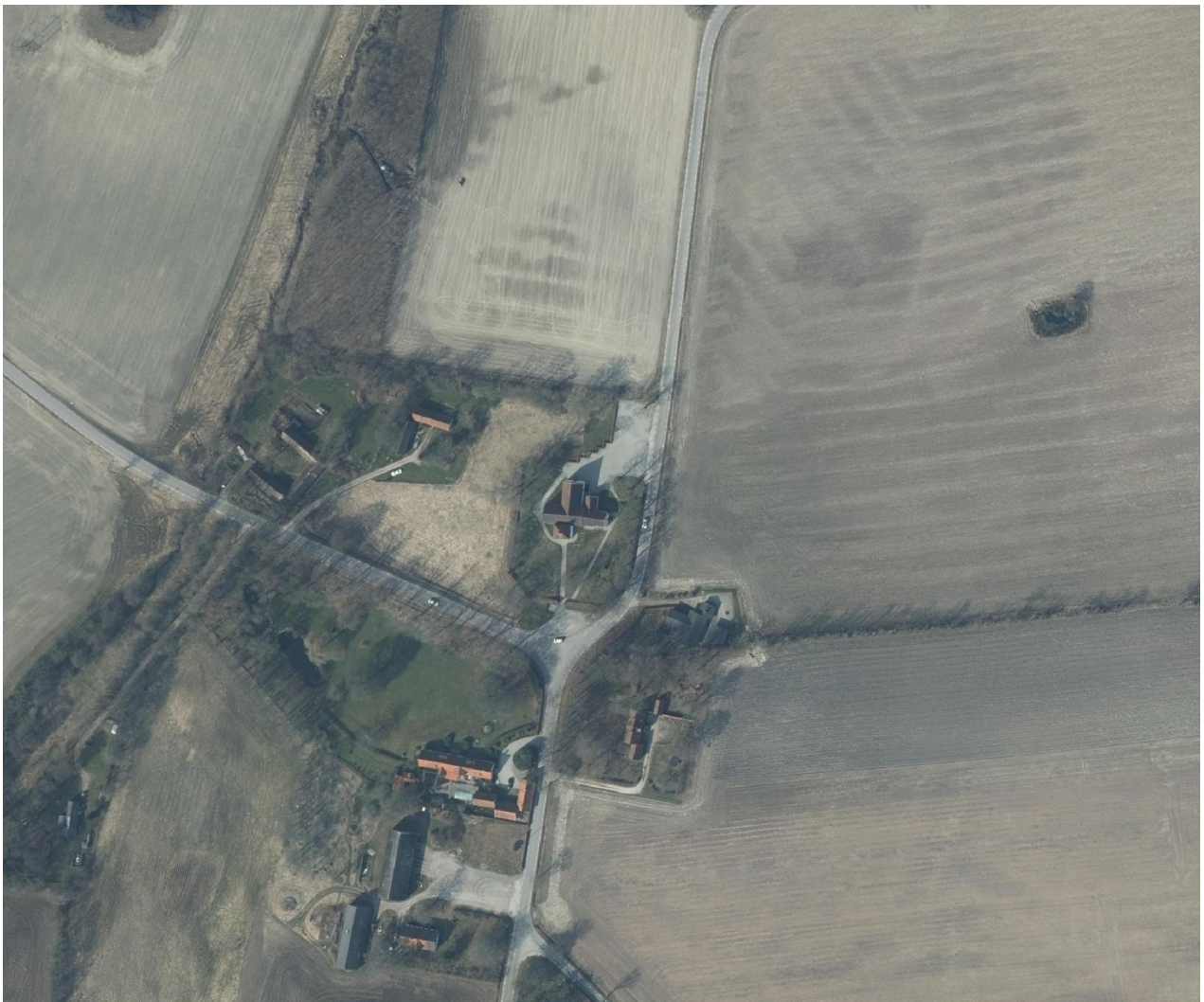
Figur 2. Högupplöst ortofoto över Stehags kyrkby med kyrkan ca 50 m norr om vägkorsningen.