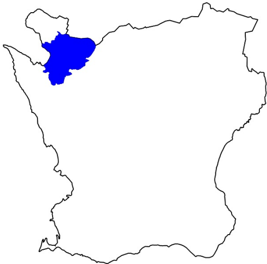
Figur 1. Karta över Skåne med Ängelholms kommun markerat med blå färg.