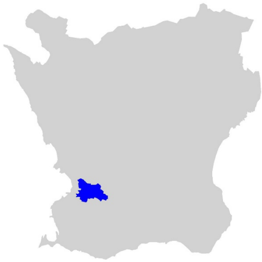
Figur 1. Karta över Skåne med Staffanstorps kommun markerat med blå färg.