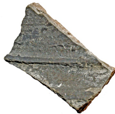
Figur 5. Skärva av yngre svartgods som framkom i ytan av anl. 1. LUHM 33 060:1. Skala 1:1.

På de historiska kartorna ligger de östliga gårdarna på rad i nord-sydlig riktning i höjd med kyrkan (gårdarna 2–4). Detta överensstämmer väl med anläggningarnas utbredning i schakten. Enligt dessa kartor bör bebyggelsens utsträckning i öster upphöra någonstans mellan schakt 1 och 4.