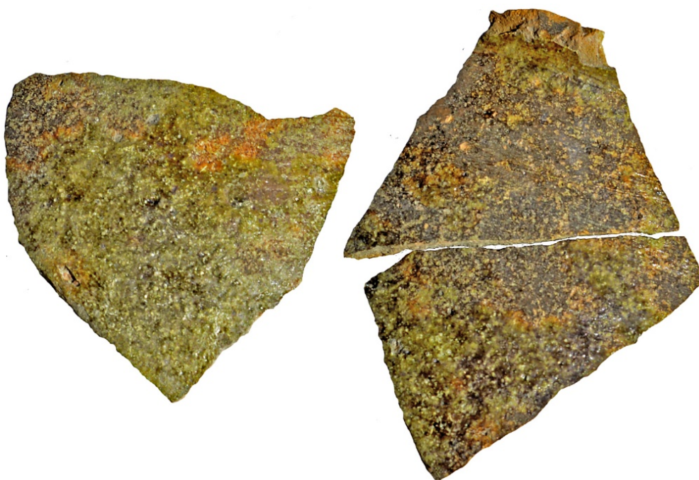
Figur 6. Keramikskärvor av äldre rödgods som framkom i ytan av anl. 1. De två skärvorna till höger har passning. LUHM 33 060:3. Skala 1:1.