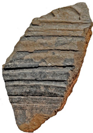
Figur 4. Östersjökeramik påträffat som lösfynd i schakt 2. LUHM 33 060:4. Skala 1:1.

schaktet framkom en skärva äldre rödgods med en ovanlig ljus grön gul glasyr. I den nordvästra delen av schaktet framkom som lösfynd två skärvor östersjökeramik (figur 4) samt foten och en skärva från en trefotsgröta av yngre rödgods. I det norra schaktet (schakt 3) framkom en igenfylld våtmark med torv i botten på dryga 2 m djup. I torven framkom en sot- och kolfläck som inte kunde dokumenteras beroende på schaktdjupet. I våtmarkens fyllning förekom rikligt med djurben och enstaka tegelbitar men inga byggnads- eller raseringslager. I schakt 4 var underlaget påverkat av markarbeten. Jorden var hårt packad och det förekom inga anläggningar eller fynd. De tre schakten i nordost (schakt 5–7) visade på ett påfallande tjockt matjordställe och det förekom dikesliknande nedgrävningar i öst–västlig riktning. Dikena föreföll inte vara gamla då fyllningen var matjordsliknande.