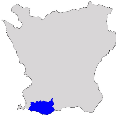
Figur 1. Karta över Skåne med Trelleborgs kommun markerat med blå färg.