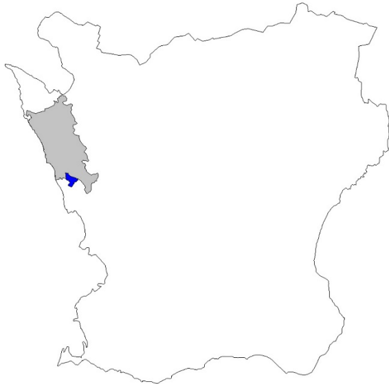
Figur 1. Karta över Skåne med Helsingborgs kommun markerat med grått och Kvistofta socken med blått.