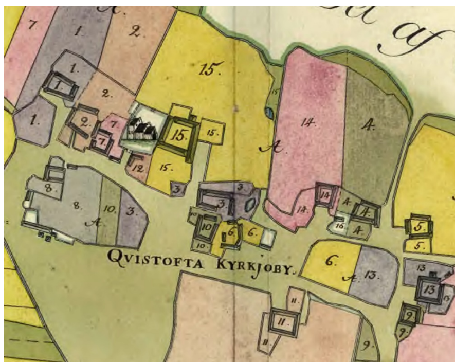
Figur 4. Figuren visar ett utsnitt av Storskifteskartan från 1761. Undersökningsområdets västra gräns går ungefär där gård nr 15 östra länga låg och väster om ägorna till gård nr 14. Den södra gränsen bör ligga någonstans mellan gård nr 3 och gård nr 10.

Anläggningarnas och lagrens utbredning överensstämmer tämligen väl med den registrerade fornlämningens begränsning (bytomten). De två parallella diken kan utgöra bytomtens gräns och har utgjorts av två diken med en mellanliggande jordvall. En gränstyp som hindrar boskapen både från att ta sig ut från bytomten och ta sig in