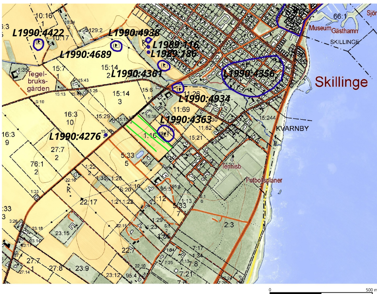
Figur 2. Del av fastighetskartan över Skillinge. De i texten beskrivna fornlämningarna är markerade med blått och fornlämningsnumren är kursiverade. Sökschakten är markerade med grön färg. © Lantmäteriet