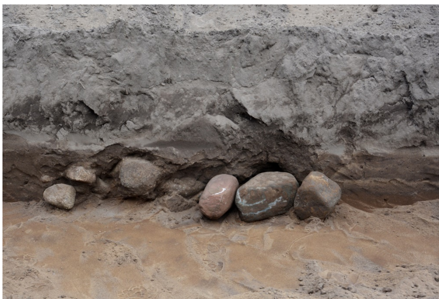
Figur 4. Foto över det röse som framkom i ett svagt humöst lager strax ovanför underlaget.

De enstaka och glest förekommande lämningarna har ett begränsat vetenskapligt värde för ny arkeologisk kunskapsuppbyggnad. Enligt Länsstyrelsens bedömning behövs därför inga ytterligare arkeologiska insatser inom området (Meddelande 2020-10-07).