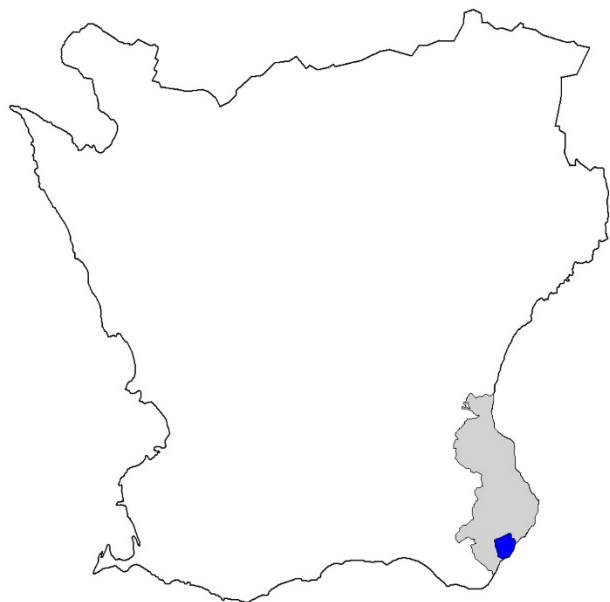
Figur 1. Karta över Skåne med Simrishamns kommun markerat med grått och Östra Hoby socken med blått.