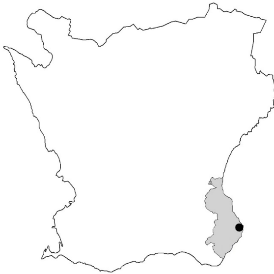
Figur 1. Karta över Skåne med Simrishamns kommun markerat med grått och Simrishamn med en svart prick.