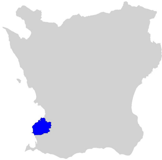
Figur 1. Karta över Skåne med Malmö kommun markerat med blått.