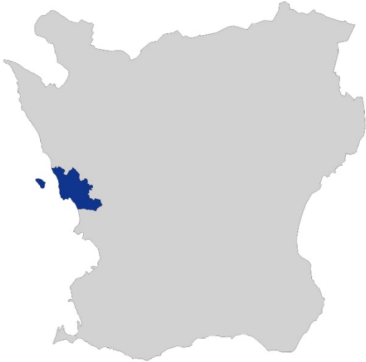
Figur 1. Karta över Skåne med Landskrona kommun markerat med blå färg.