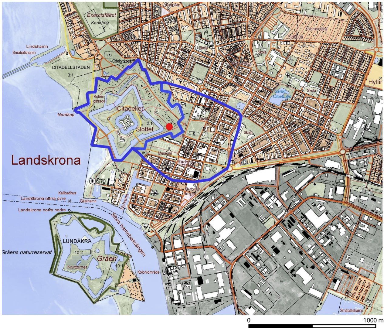
Figur 2. Del av fastighetskartan över Landskrona med fornlämningsbegränsningen markerad med blå linje. Platsen för undersökningen är markerad med en röd fylld cirkel.