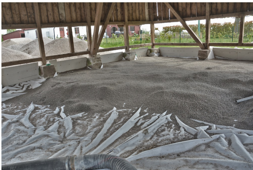
Figur 3. Fotot visar fiberduken och det skyddande gruslagret

I samband med urschaktning inne i en äldre lada påträffades en skelettgrav. Den påträffade graven och ytterligare två gravar har dokumenterats av Statens Historiska museum. Enligt beslut av länsstyrelsen skulle marken därefter täckas med fiberduk och ett skyddande sandlager. Inga tunga maskiner skulle tillåtas köra inom området som ska skyddas. Sökanden valde då att föra in materialet i byggnaden med en sugbil som först sög upp materialet och sedan blåste ut det inne i byggnaden. Sugbilen klarade dock inte vanlig sand utan man var tvungen att gå upp i fraktion till 4–8 mm vilket motsvarar fin trottoarsingel. Den valda fraktionen kommer att ge ett tillräckligt bra skydd för underliggande gravar i och med att fiberduken kommer hindra gruskornen från att tryckas ned i underlaget. Underlaget var vid besiktningen mycket hårt. Ovanför skyddslaget kommer sedan fiberduk, vanlig makadamcellplast (frigolit) och betong. Marktrycket kommer inte påverka gravarna.