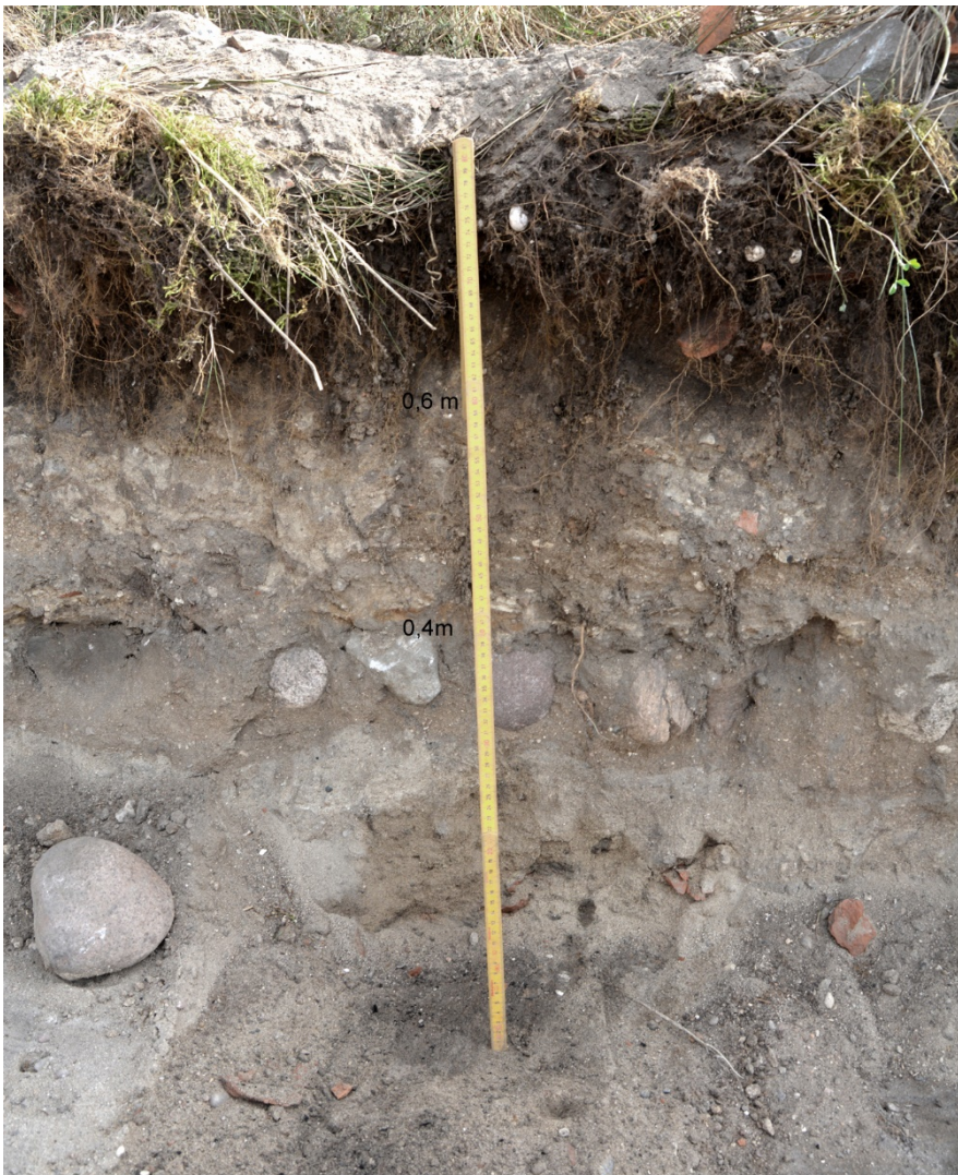
Figur 4. Fotot visar ett parti av schaktväggen i östra schaktet. Tumstocken står på kulturlagret. Den översta stenläggningen finns strax under grästorven.

För att erhålla kunskap om under hur lång tid kulturlagret bildats krävs ytterligare undersökning av lagret. Detta görs lämpligast genom att delar av lagret undersöks avseende fyndinnehåll och om möjligt bedöma eventuell förekomst av anläggningar under kulturlagret.