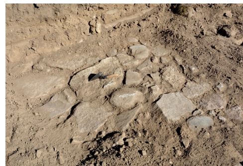
Figur 3. Del av stenläggningen framrensad.

Förundersökningen genomfördes i form av sökschaktning med grävmaskin. Schakt och strukturer mättes in med en RTK-GNSS (GPS). Delar av matjorden, en stenläggning samt gruslagret ovanför stenläggningen undersöktes med metalldetektor.