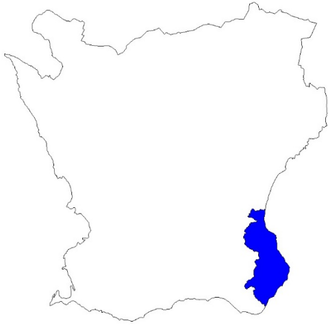
Figur 1. Karta över Skåne med Simrishamns kommun markerat med blått.