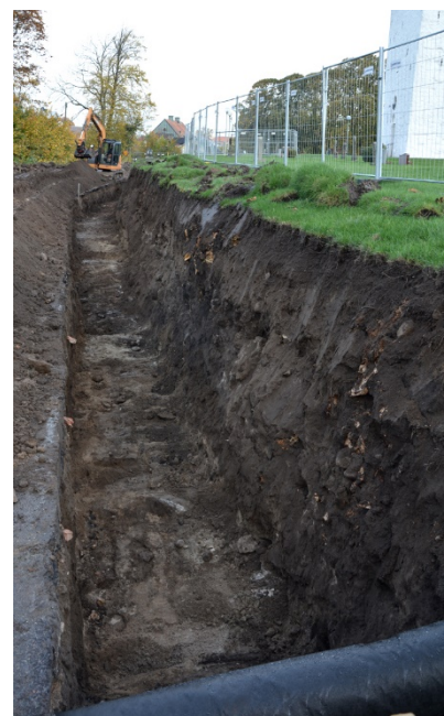
Figur 4. Område 1 från söder.