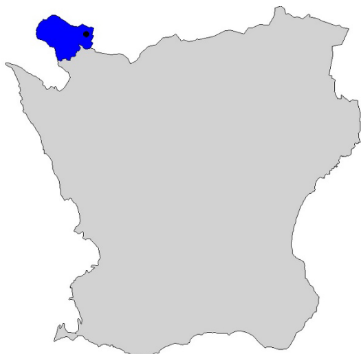
Figur 1. Karta över Skåne med Båstads kommun markerat med blått och Östra Karup med svart prick.