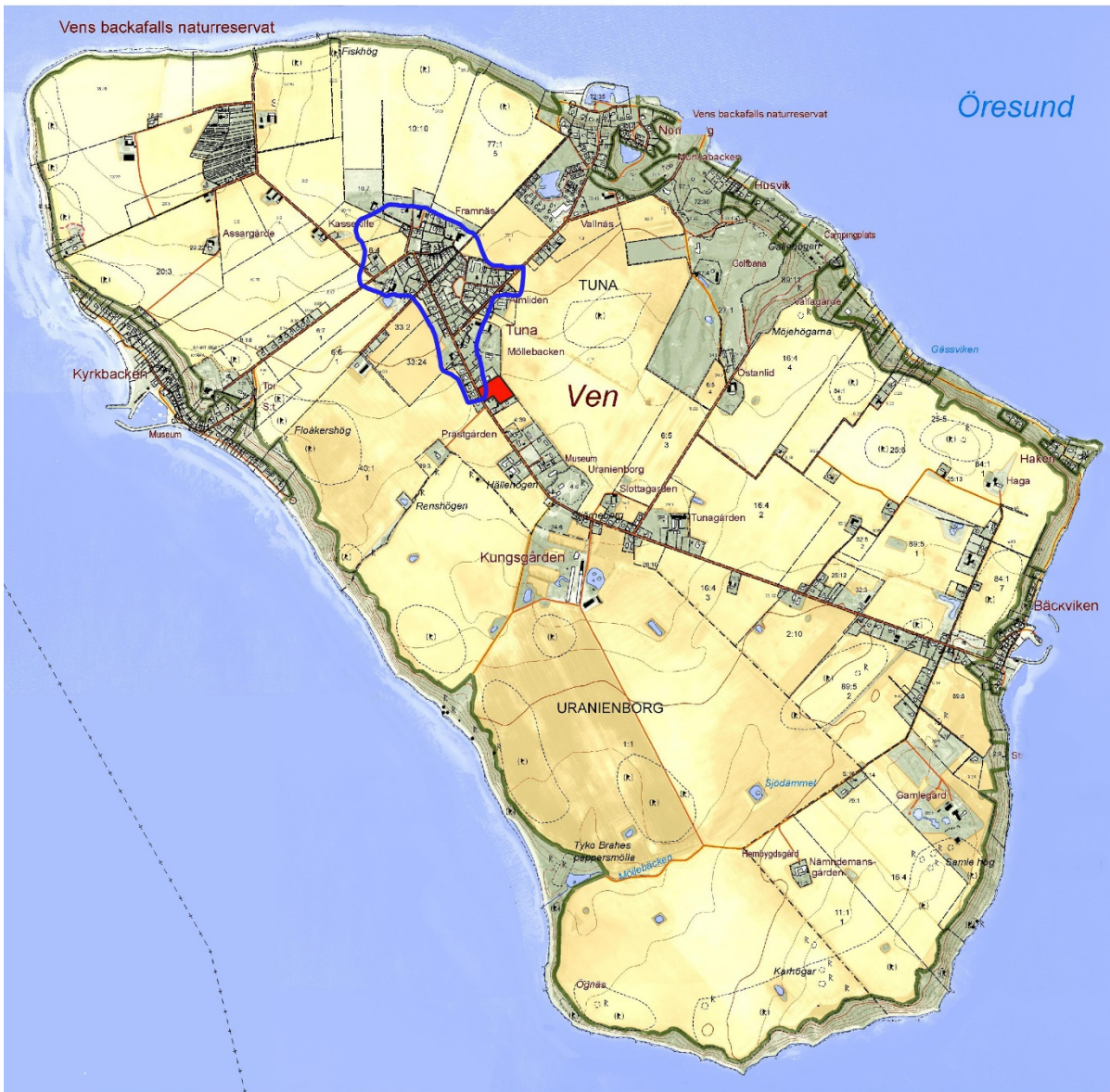
Figur 2. Fastighetskartan över Ven med fornlämningsbegränsningen för Tuna bytomt (L1988:5974) markerad med blå linje. Undersökningsområdet är markerat med rött