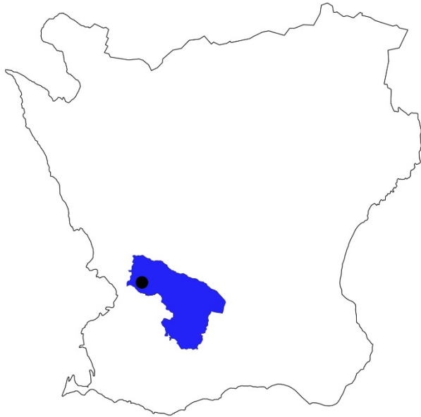
Figur 1. Karta över Skåne med Lunds kommun markerat med blå färg och Lunds stad med svart prick.