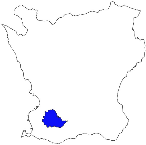
Figur 1. Karta över Skåne med Svedala kommun markerat med blått.