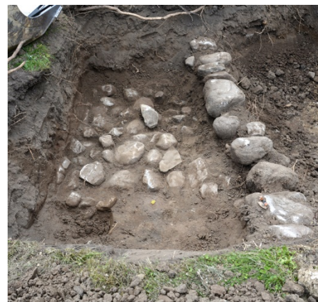
Figur 3. Grundmuren syns till höger i bilden. Foto från norr.

Den grundmur som framkom härrör troligtvis från gård nr 3 enligt Geometrisk avmätning från 1703.