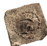
Figur 3. Skatte- eller kontrollmärke av bly (LUHM 33 328:2). Skala 1:1.