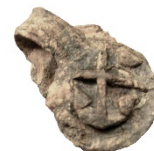
Figur 4. Klädesplomb av bly med ett ankare. (LUHM 33 328:1). Skala 1:1.