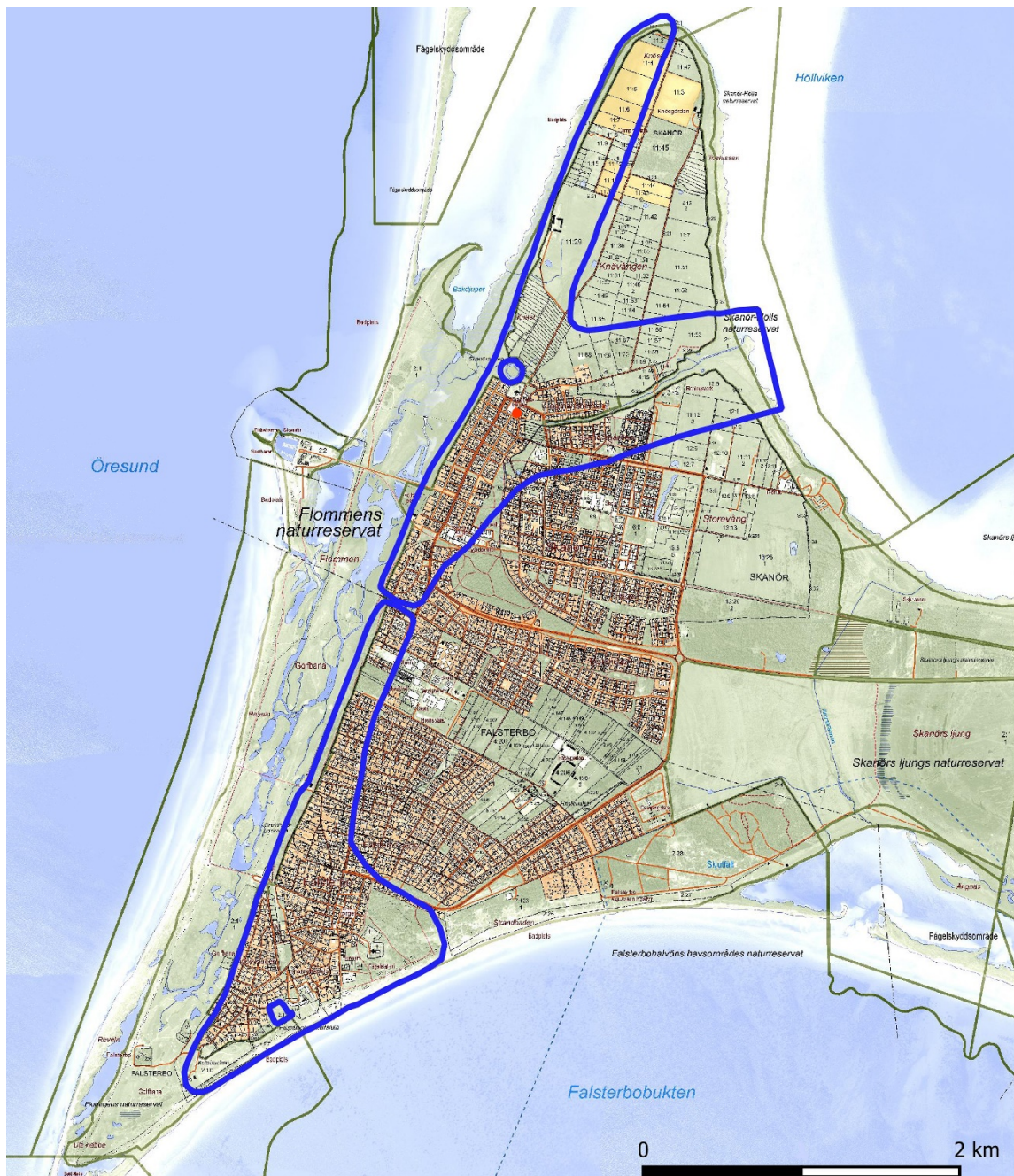
Figur 2. Del av fastighetskartan över Näsät. Undersökningsområdet är markerat med röd prick. Fornlämningar i form av Falsterbos och Skanörs medeltida utbredning och de två borgarna i Falsterbo och Skanör är markerad med blå linje. ©Lantmäteriet