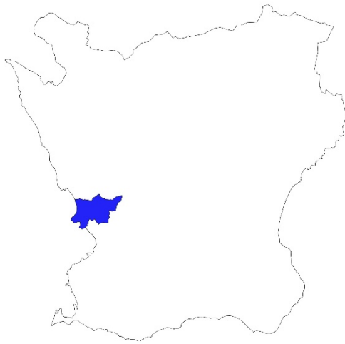
Figur 1. Karta över Skåne med Kävlinge kommun markerat med blått.